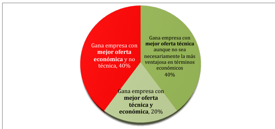
Figura 3. Incidencia de la oferta económica en la adjudicación

Entre las licitaciones analizadas, esto sucede en un 60% de los casos, si bien es cierto que un 20% de ellas ya había recibido previamente la mejor valoración técnica. Así todo, no es nada desdeñable el hecho de que en un 40% de los casos se hubiera impuesto la propuesta más barata, aun no siendo esta la más conveniente desde el punto de vista técnico y de calidad.