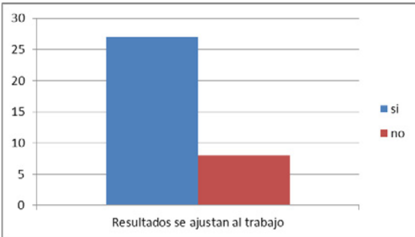
Gráfico 2. Percepción del alumno en cuanto a los resultados que se obtendrán al ser evaluados por sus compañeros

Con respecto a si consideran que los resultados que obtendrán en la valoración realizada por sus compañeros se ajustará a lo que ellos consideran idóneo, el 77,14% consideran que si se ajustará (gráfico2), con respecto a si consideran adecuado que les evalúe un compañero se observa que el 68,57% considera que es adecuado (gráfico3).